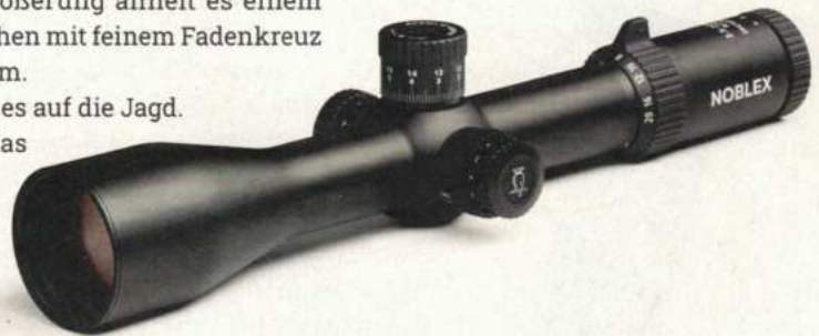
Der Rohrdurchmesser von 34 mm gewährleistet mehr Verstellweg für sichere Schüsse bis zu 2.000 m (32 mils)

Beim Noblex NZ handelt sich um ein wirklich erstaunliches Zielfernrohr, denn obwohl es eine Art Hybrid sowohl für die Jagd als auch den Schießsport darstellt, muss man in keiner dieser beiden Disziplinen Abstriche in Kauf nehmen. Bei einer UVP von gerade einmal 1.499,- € ist auch das Preis-Leistungs-Verhältnis des Noblex NZ8 2,5-20x50 LR nicht zu schlagen. Wenn man unbedingt irgendetwas bemängeln will, dann vielleicht die Tatsache, dass eine minimale 2,5-fache Vergrößerung auf Drückjagden in besonderen Situationen ein bisschen viel sein kann. Aber wie gesagt, die eierlegende Wollmilchsau gibt es eben einfach nicht. ■